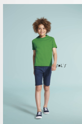
IMPERIAL KIDS 11770