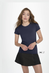
IMPERIAL FIT WOMEN 02080